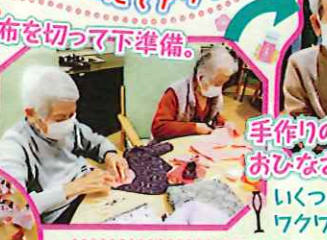
布を切って下準備。 手作りのおひなさま