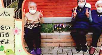
仲良しのお友達と一緒に散歩してました!