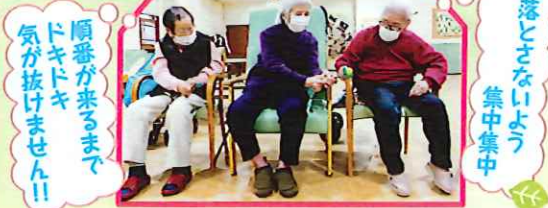
順番が来るまでドキドキ 気が抜けません!! 落とさないよう 集中集中