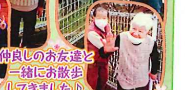
仲良しのお友達と一緒に散歩してました!