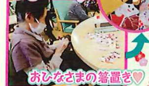
おひなさまの箸置き♡