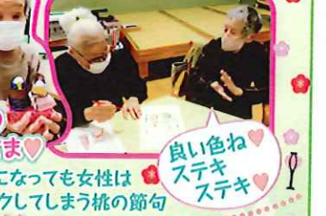
良い色ねステキステキ いくつになっても女性はワクワクしてしまう桃の節句