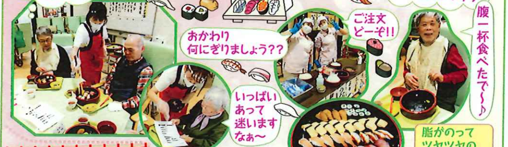
にぎり寿司の日に当たるなんてなんでもラッキーなんだ!! いつもご飯を提供して下さっている給食会社のスタッフさん。この日は寿司職人さんです! 腹一杯食べたで... ご注文どーぞ!! おかわり何にぎりましょう?? いっぱいあつて迷いますなあ~