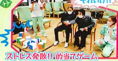
ストレス発散!! 的当てゲーム