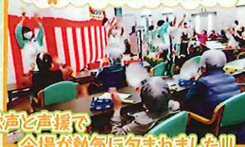
歓声と声援で会場が熱気に包まれました!!