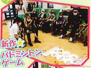
新作! パドミントンゲーム