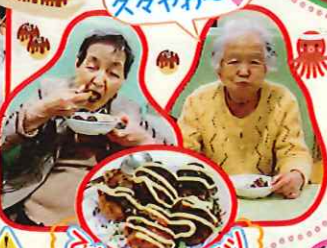
たこやき 欠々やわ~ たきたてアツイ!