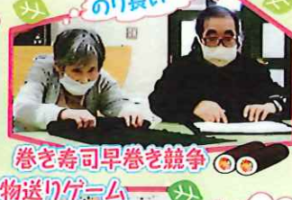
巻き寿司早巻を競争 物送りゲーム