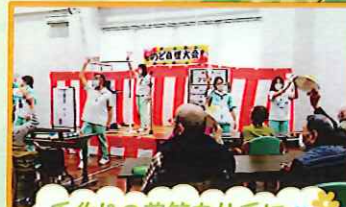
手作りの花笠を片手に 花笠音頭で歌体操!!