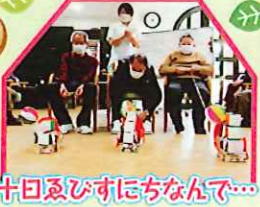
残り福呼び寄せ 十日ゑびすにちなんで...

定番のゲームや季節感のあるものなど、毎日来て飽きない・楽しいを目指し、思わず頭や身体を動かしたくなるレクリエーションを取り入れています。スタッフも一緒に大笑いしています(笑)