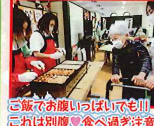
ご飯でお腹いっぱいでも!! これは別腹♡食へ過ぎ注意!