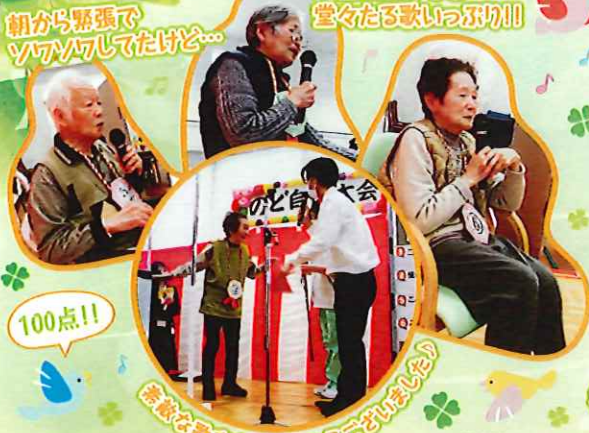
朝から緊張でソワソワしてたけど... 舞台上がると堂々たる歌いぶり!! 100点!! 聴衆を歌声をありがとうごさいます!!