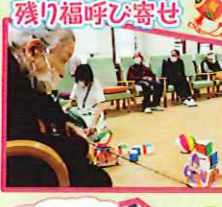
福は内~!! 鬼は外~!! のり長い...