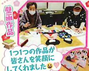
壁面作品 1つ1つの作品が皆さんを笑顔にしてくれました